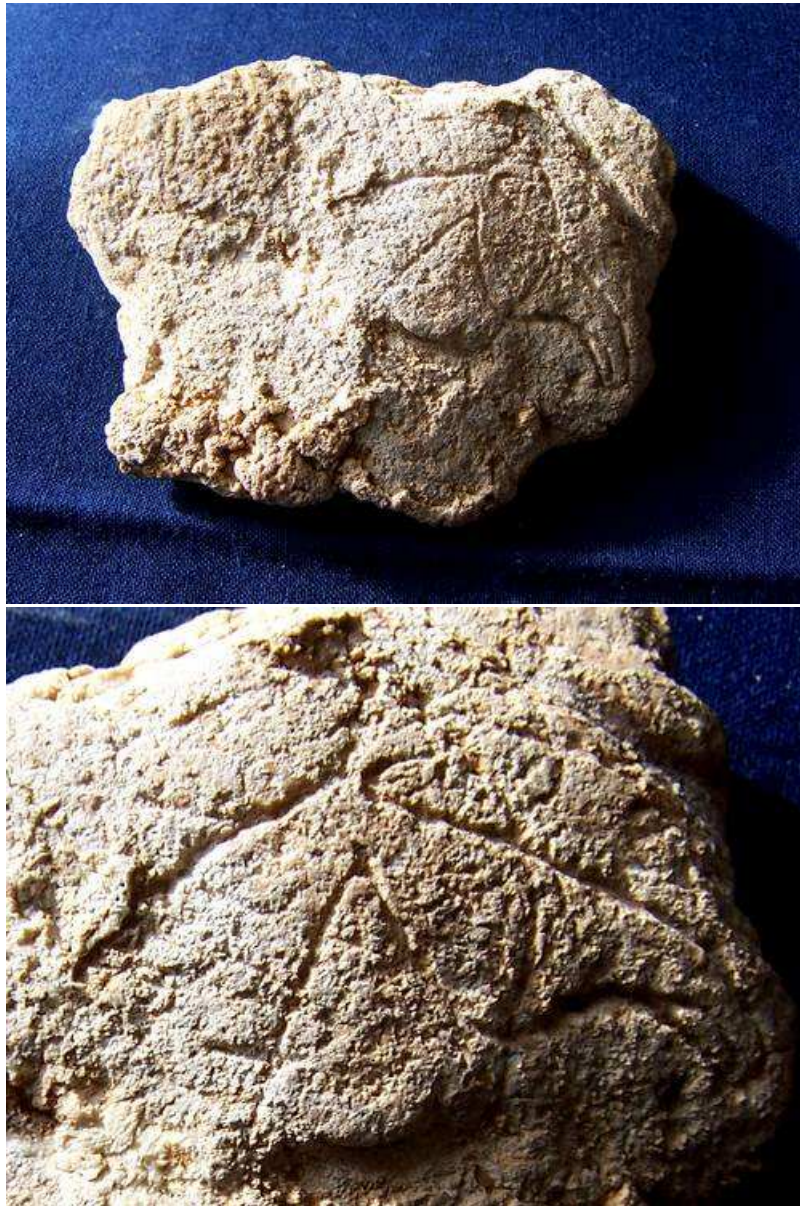
La « pierre aux graffiti » et son profil d'équidé « en bec de canard ».

Cet objet, de dimension décimétrique, présente des tracés dont l'organisation a tout de suite attiré notre attention. Nous y avons reconnu une tête d'équidé qui se confond avec une représentation symbolique : encore un petit triangle – ou un petit « chevron » - coupé par une ligne médiane et barré de lignes transversales sub-parallèles. Cette analyse est depuis validée et précisée par les préhistoriens : il s'agit bien d'une tête de cheval au profil dit « en bec de canard » associée à une thématique triangulaire très proche de celle que nous rencontrons sur deux autres plaquettes de la Vallée du Bruant.