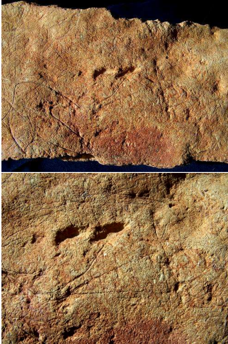
La « plaquette rubéfiée » et son triangle barré.

Le triangle de la plaquette rubéfiée possède deux côtés de 83 mm et 88 mm et une base de 61 mm. Le milieu de cette base est, à 2 mm près, le point de départ d'une hauteur de 79 mm qui s'élève jusqu'au sommet opposé. Comme sur la plaquette découverte dans la Grotte du Triangle, on discerne une dizaine de traits parallèles transversaux, tantôt perpendiculaires à la ligne médiane, tantôt légèrement obliques, espacés de 5 à 6 mm.