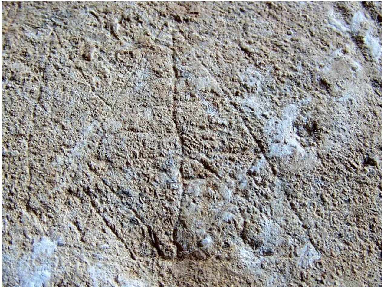
Triangle principal de la plaquette gravée de la «Grotte du Triangle», découverte en 2005.

Triangle récemment identifié sur la « plaquette rubéfiée » recueillie en 1924 dans les Grottes du Bouil-Bleu.