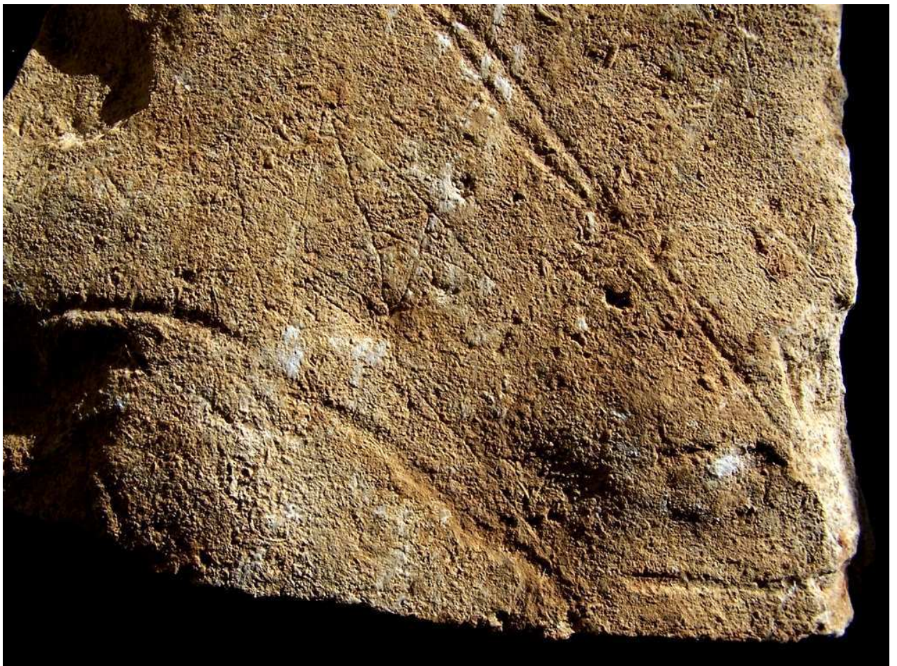
Plaquette gravée de la « Grotte du Triangle », découverte en 2005 sur le Domaine de La Roche Courbon.